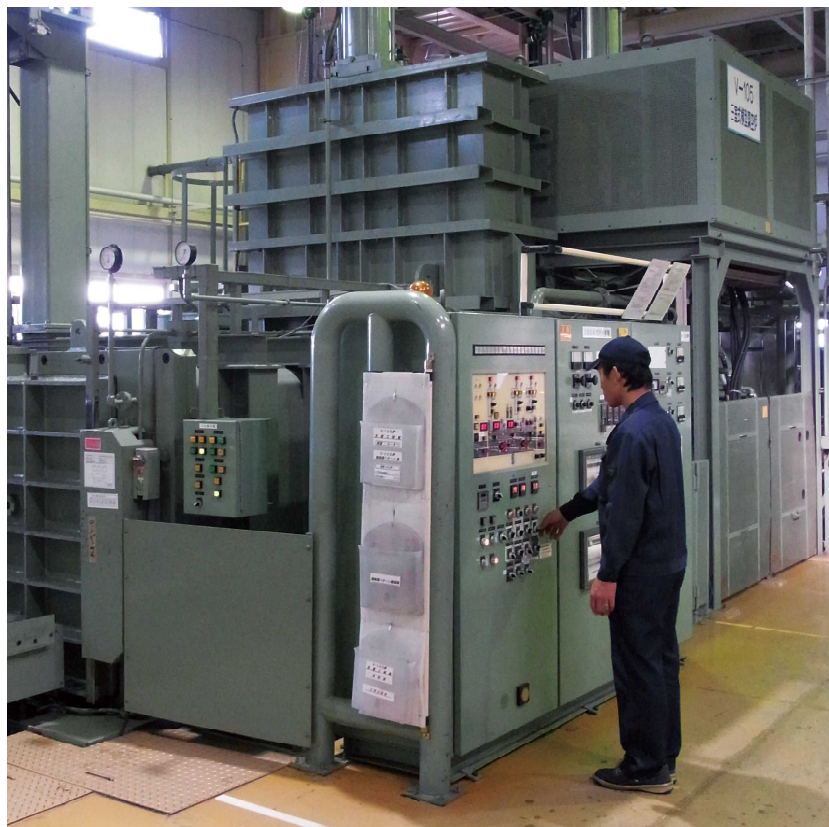
三室式横型真空炉 ▶

真空熱処理、雰囲気熱処理を中心としたあらゆる金属材料熱処理ソリューションをお客様に提供し、自動車分野、産業機械、航空・宇宙、医療など多くの分野で部品、金型などの熱処理で実績があります。