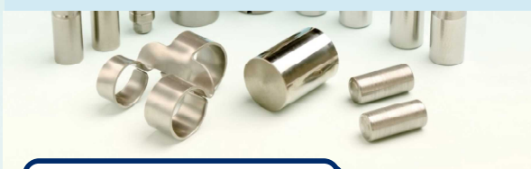
真空焼き入れ・焼き戻し

素材、製品、中間品の応力除去、均質化、溶体化など行います。炭素鋼、合金鋼、ステンレス鋼、チタン、チタン合金、Ni基合金、Co基合金、銅合金など。